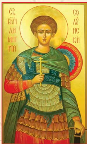
Sfântul Mare Mucenic Dimitrie, izvorătorul de mir

"Cu curgerile sângiurilor tale, Sfinte Mare Mucenice Dimitrie, Biserica Dumnezeu a înroșit-o, Cel Ce ți-a dat ție tărie nebiruită; și păzește cetatea ta nevătămată, căci tu ești întărirea ei."