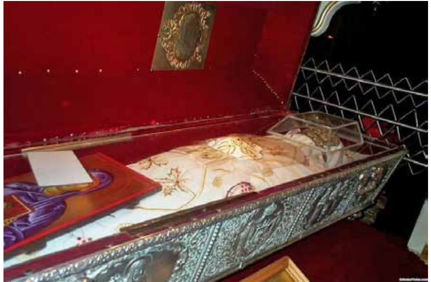
Racla Sf Parascheva din catedrala din Iași

După aproximativ 200 de ani moaștele Sfintei Parascheva au fost mutate la Târnovo - capitala Imperiului vlaho-bulgar;