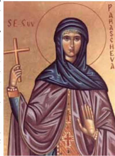
Sfânta Cuvioasă Parascheva

Această mare virtute sufletească a Paraschevei era reflectată și pe fața ei tânără deoarece sufletul luminează fața și o face foarte frumoasă. Prin urmare, Parascheva a fost cerută în căsătorie de tineri bogați care aveau o stare socială importantă și înalte dregătorii,