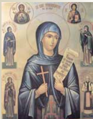
Sfânta Cuvioasă Parascheva (14 octombrie)

“Preacuvioasei noastre maici, mult-milostivei Parascheva, prin osârdie îi aducem noi nevrednicii păcătoși pentru mijlocirile sale. Că mari daruri ne-am învrednicit a dobândi, de la izvorul cel pururea curgător de bunătăți al Mântuitorului nostru, și să-i cântăm : Bucură-te, Paraschevo, mult folositoare!”