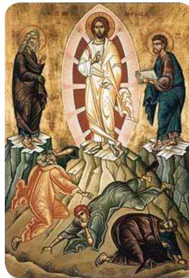
Schimbarea la Față a Domnului Iisus Hristos pe muntele Taborului

atunci proorocirea: „Străpuns-au mainile Mele și picioarele Mele”, cu cine se va împlini? Apoi, „împartit-au hainele Mele între ei și pentru cămășa Mea au aruncat sortii”, cui se vor potrivi? Și, iarăși: „Dat-au spre mănăcarea Mea, fiere și, spre setea Mea M-au adaptat cu otet”, cui se vor întâmpla? Apoi, „Întru cei morți, slobod” cine îl va adevăra? Deci, de vom rămâne aici, înscrisul lui Adam,