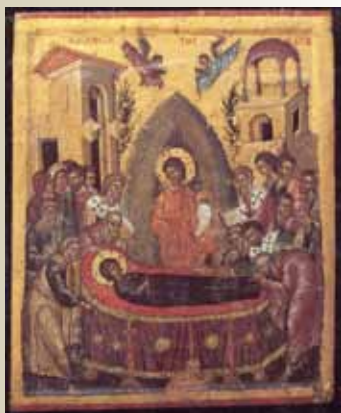
Adormirea Maicii Domnului (15 august)

“Apărătoare Doamnă, pentru biruință mulțumiri, izbăvindu-ne din veșnica moarte, prin darul Celui ce S-a născut din tine, Hristos Dumnezeul nostru și prin mijlocirea ta cea de maică înaintea Lui, aducem ție, noi, robii tăi. Ci, ca ceea ce ai stăpânire nebiruită, izbăvește-ne pe noi robii tăi din toate nevoile și suferințele, care strigăm ție: Bucură-te, cea plină de dar, Născătoare de Dumnezeu Fecioară, bucuria tuturor celor necăjiți!”