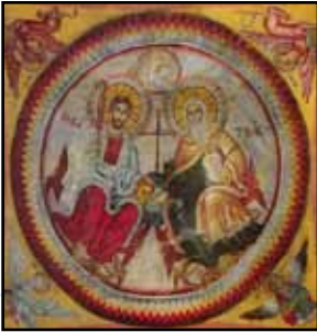
Sfânta Treime Pictură murală comună la Mănăstirile din Sfântul Munte