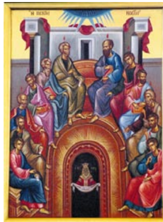
Pogorârea Duhului Sfânt

De ce se numește Sfîntul Duh “Mîngîietorul” și “Duhul Adevărului”? Pentru că Duhul Sfânt mîngîie pe creștini cît sînt pe pământ. El mîngîie mamele care nasc și cresc copii, mîngîie pe copiii orfani, pe săraci, pe infirmi, pe văduve și pe cei bolnavi și pe bătrîni. Duhul Sfânt mîngîie și întărește în credință și în răbdare pe mucenicii care rabdă grele chinuri și își dau viața pentru Hristos. Duhul Sfânt mîngîie pe credincioși, pe călugări și pe slujitorii Bisericii în timpul rugăciunii și