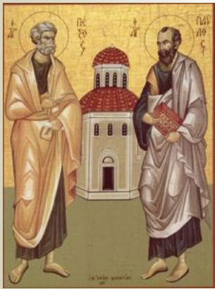
Sfinții Apostoli Petru și Pavel (29 iunie)

Pe cei ce împreună cu oamenii s-au arătat mai înainte îngerește cugetând, și acum cu îngerii fiind, cu cântări îngerești și lui Dumnezeu cuvioase, să laudăm pe întâi stătătorii Apostolilor, ca pe cei ce sunt izbăvitorii sufletelor noastre, strigând: Bucurați-vă Petru și Pavele, Apostolilor!