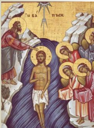
Botezul Domnului (6 ianuarie)

“Arătat-Te-ai astăzi lumii și lumina Ta, Doamne, s-a însemnat peste noi, care cu cunoștință Te lăudăm. Venit-ai și Te-ai arătat, Lumina cea neapropiată.”