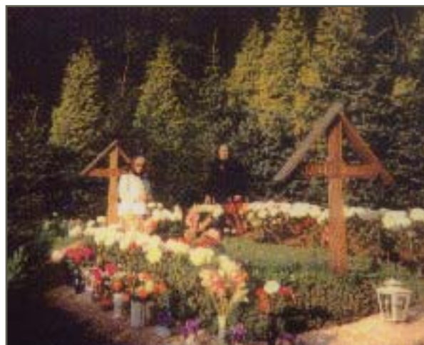
Un loc de pelerinaj obișnuit pentru binecredincioșii români de pretutindeni: Mormântul Părintelui Arsenie Boca de la Mănăstirea Prislop.

Mormântul părintelui Arsenie de la mănăstirea Prislop constituie și azi un loc de pelerinaj pentru sute de creștini din țară care l-au cunoscut și în conștiința cărora părintele a rămas ca un om cu viață sfântă.