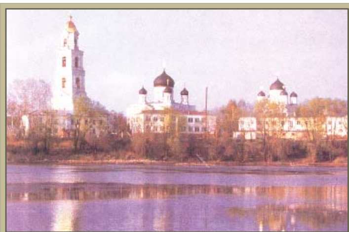
Mănăstirea din Diveyevo, lăcașul construit prin viziunea Sfântului Serafim, și care găzduiește în zilele noastre moaștele Sfântului

"Puteți judeca cât de mare este puterea rugăciunii, atunci când este săvârșită din toată inima, chiar și în cazul unei persoane păcătoase, în următoarea pilda din Sfânta Tradiție. Când, la rugămintea unei mame desperate careia îi murise singurul fiu, o prostituată pe care o întâlnise, încă necurată după ultimul ei pacat, mișcată fiind de durerea adâncă a mamei, a strigat către Domnul: "Nu de dragul unei sărmane păcătoase ca mine, ci pentru lacrimile unei mame ce-și jelește fiul și crezând cu tarie în bunătatea Ta cea plină de dragoste și în puterea Ta cea nemăsurată, Hristoase Dumnezeule, înviază-l pe fiul ei, o,