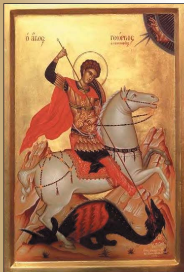
Sfântul Mare Mucenic Gheorghe, purtătorul de biruință

“Ca un izbăvitor al celor robiți și celor săraci folositor, neputincioșilor doctor, conducătorilor ajutător, Purtătorule de biruință, Mare Muce- nice Gheorghe, roagă pe Hristos Dumnezeu să mântuiască sufletele noastre.”